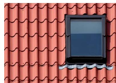
Esempi di applicazione